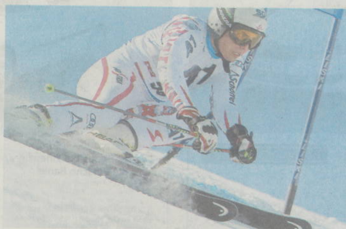
Im Riesentorlauf-Europacup die Nummer eins: Marcel Mathis.

Für Mathis geht es morgen im Weltcup mit dem Riesentorlauf in Crans-Montana weiter. Die Leistung von Bansko vor einer Woche spülte ihn in der Startliste auf Platz 25 nach vorne, einen Platz hinter Bode Miller übrigens.