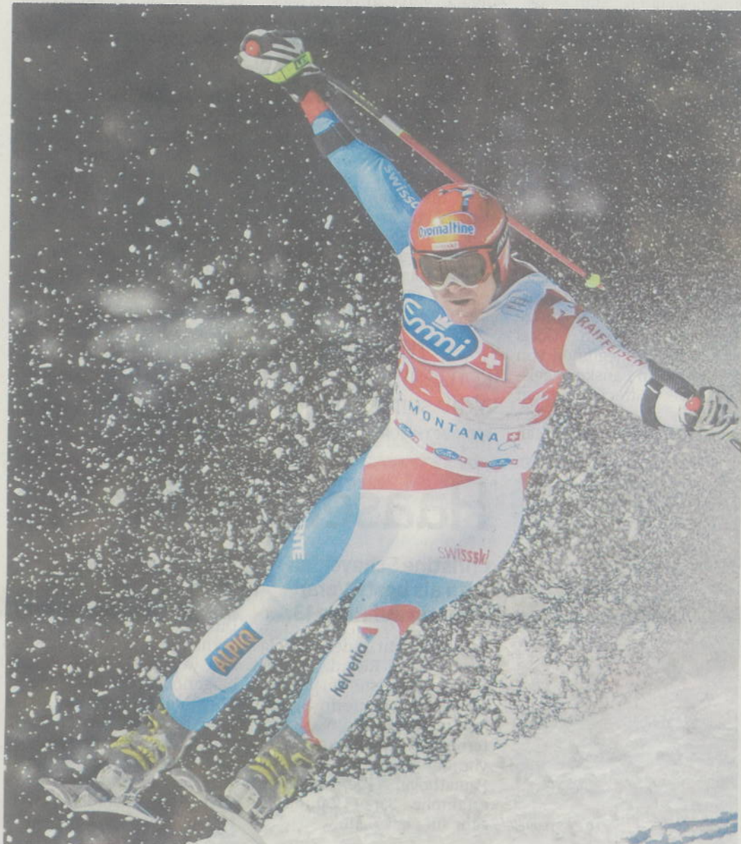
Wenn er fährt, staubt es: Didier Cucho bei seiner Siegesfahrt im Super-G von Crans-Montana.