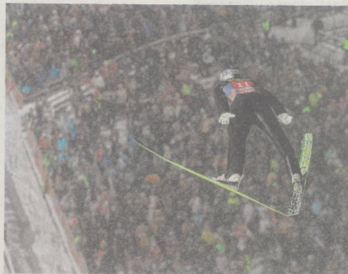
Auf der Schattenbergschanze in Oberstdorf startet am 29. Dezember die 61. Auflage der Vierschanzentournee.

Alle Schanzen mit Kühlsystem Nach den Skiclubs in Oberstdorf und Garmisch-Partenkirchen gaben nun auch die Organisationskomitees in Innsbruck und Bischofshofen grünes Licht. „Wir haben im Schmirntal zuletzt bei