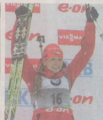
Premiersiegerin in Pokljuka: Gabriela Soukalova.

1. Tora Berger (NOR) 296 Punkte, 2. Darja Domratschewa (BLR) 244, 3. Andrea Henkel (GER) 206. Weiter: 62. Schwabl 9 - 68. Schrempf 6 Sprint-Wertung nach 3 von 10 Bewerben: 1. Berger 122,2. Soukalova 114, 3. Skardino 101. Weiter: 50. Schwabl 9, 58. Schrempf 6.